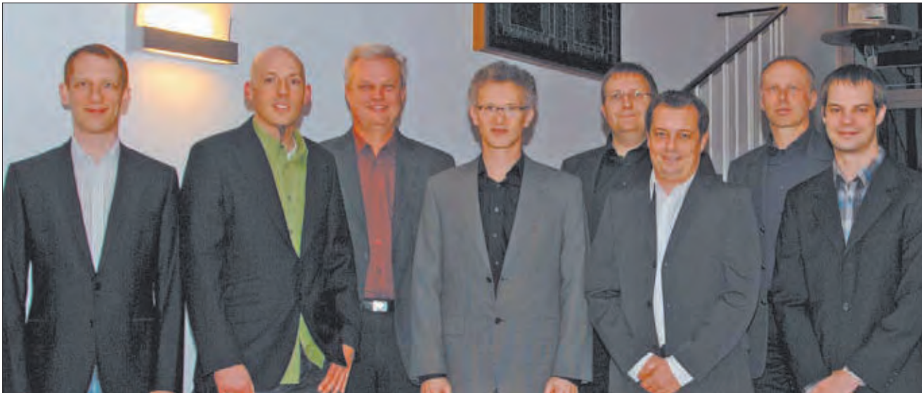
Die IT-Security Experts Vorarlberg verbessern Ihre IT-Sicherheit.